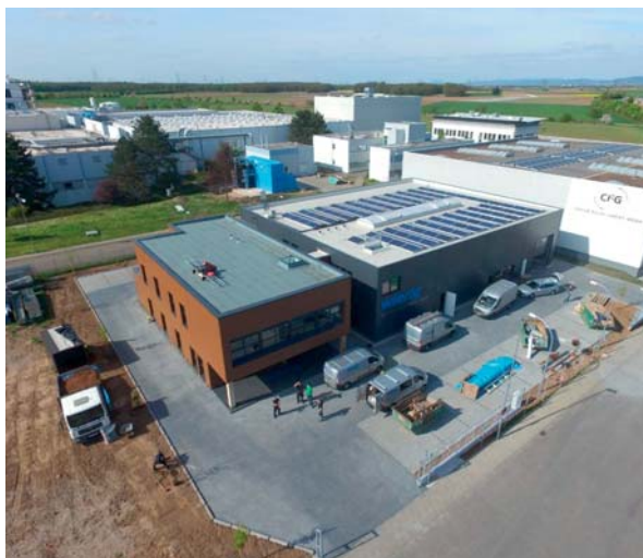
Bild 3: Neubau der Wierig & Huhn GmbH in Plankstadt.

elektrische Module und kann somit auf der gesamten verfügbaren Fläche Wärme und Strom gewinnen. Dabei liegen die thermischen Kollektoren unter den Photovoltaik-Modulen und werden vollständig von diesen verdeckt (Bild 2).