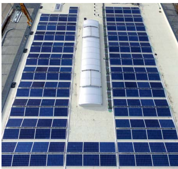
Bild 4: Das Kraftdach aus der Vogel- perspektive.

Während der Sommermonate können sich die Zellen der Solarstrom-Module stark erwärmen. Temperaturen um 75 °C sind dabei keine Seltenheit. Dies führt zu hohen Ertragseinbußen. Beim Kraftdach fällt dieser Effekt deutlich geringer aus, da die unterliegenden thermischen Kollektoren nicht von direkter Sonneneinstrahlung getroffen werden und somit eine niedrigere Oberflächentemperatur haben. An heißen Tagen werden die